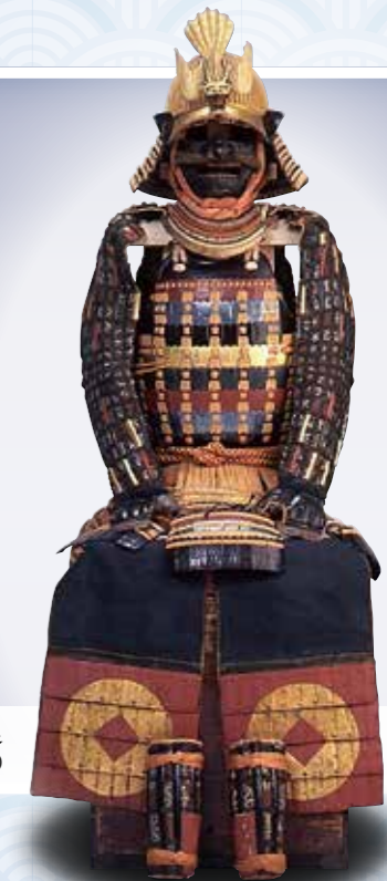
緋色段塗二枚胴具足 (松山藩主松平定功所用)

期間：4月20日(日)～6月16日(日) 会場：文書展示室 観覧料：常設展観覧券が必要です