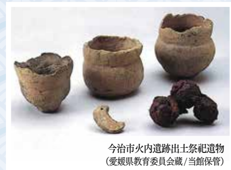
今治市火内遺跡出土祭祀遺物 (愛媛県教育委員会蔵/当館保管)