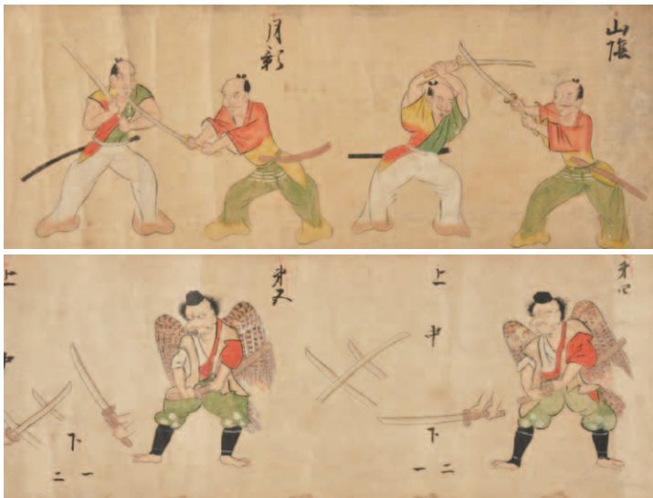
年代:江戸時代初期 サイズ:縦20.0cm 所蔵:個人蔵・当館寄託

これらの内容は、近世社会における武芸の伝授などを考えていく上で貴重な資料であり、今後、関連資料も調査した上で、その詳細な内容や歴史的価値を把握していきたいと考えています。