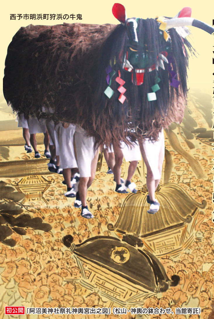
西予市明浜町狩浜の牛鬼