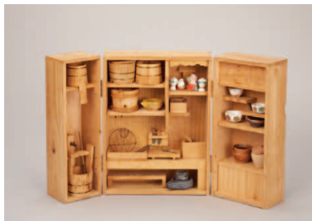
(2)年代: 昭和初期 サイズ: 高25.8cm 所蔵: 個人蔵

飾って桃の節句をお祝いする様子からは、小さい頃から身近な家事を教えようとする親の思いや当時の人々の憧れもうかがい知ることができます。