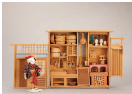
(1)年代: 明治時代 サイズ: 高27.2cm 所蔵: 当館蔵

お雛さまのお台所ともいえる水屋道具も、時代が下るとともに井戸が水道の蛇口へと代わり、くどがガスへと代わるなど、生活スタイルの変化や道具の進化の過程を一目で見ることができます。またブリキの玩具が普及すると、ブリキでできたキッチンや冷蔵庫・洗濯機など、人々の憧れの台所道具が雑段に飾られる例も見受けられます。雑道具は黒漆塗りに金蒔絵が施された筆筒や長持ち、御膳などのミニチュアをイメージしがちですが、雑道具として身近な水屋道具と一緒に