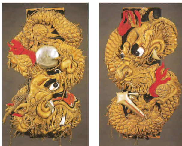
年代 明治時代 サイズ 高さ102cm 幅73cm 所蔵 新開町自治会蔵・当館保管

さて、この布団締めは香川県坂出市の秋祭りの太鼓台で使われていたもので、もともとは大正十年頃