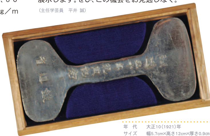
年代 大正10(1921)年 サイズ 幅5.7cm×高さ12cm×厚さ0.9cm 所蔵 個人蔵／当館保管