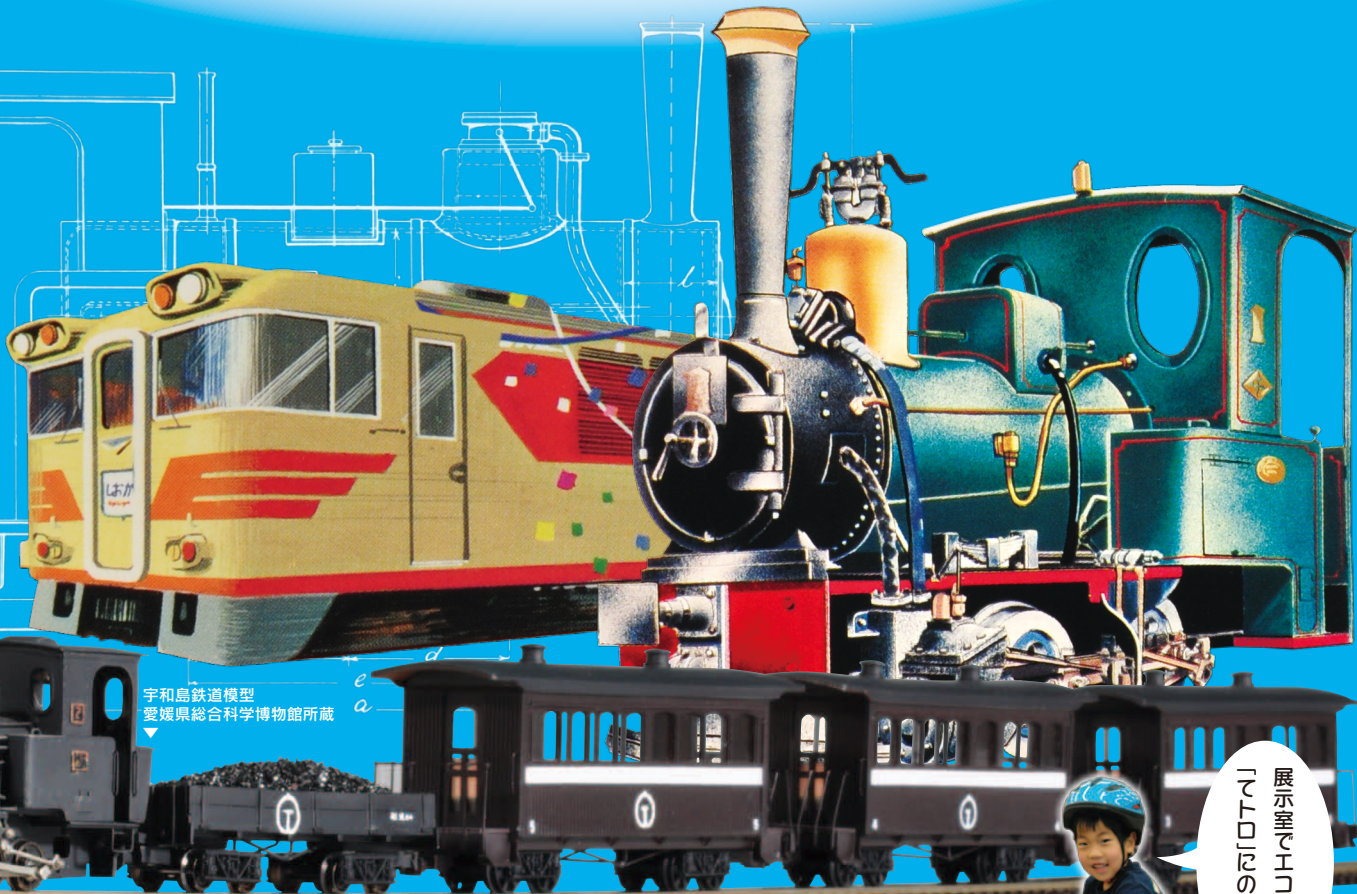
宇和島鉄道模型 愛媛県総合科学博物館所蔵

Museum of EHIME History and Culture's News